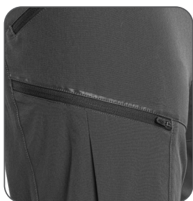
pravá boční kapsa pravé bočné vrecko right side pocket prawa kieszeń boczna