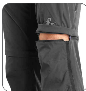
odepínací nohavice s barevným odlišením odnímateľné nohavice s farebným odlišením detachable legs with color differentiation odpinane spodnie z rozróżnieniem kolorystycznym